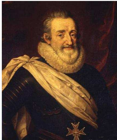
Enrique IV de Francia.

En 1718 su tragedia Edipo y en 1723 su epopeya, La Henriade , dedicada al rey Enrique IV 8 , tuvieron un gran éxito.