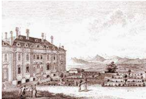
Casa de Voltaire en Ferney.

Se instaló en la propiedad de Ferney, donde viviría durante dieciocho años, recibiría a la élite de los principales países de Europa, representaría sus tragedias ( Tancredo , 1760), mantendría una copiosa correspondencia y multiplicaría los escritos polémicos y subversivos con el objetivo de contrariar el fanatismo clerical.