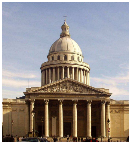
El Panteón de París.

Voltaire alcanzó la celebridad gracias a sus escritos literarios y sobre todo filosóficos. Voltaire no ve oposición entre una sociedad alienante y un individuo oprimido, idea defendida por Jean-Jacques Rousseau 19 , sino que cree en un sentimiento universal e innato de la justicia, que tiene que reflejarse en las leyes de todas las sociedades. La vida en común exige una convención, un «pacto social» para preservar el interés de cada uno. El instinto y la razón del individuo le lleva a respetar y promover tal pacto. El propósito de la moral es enseñarnos los principios de esta convivencia fructífera. La labor del hombre es tomar su destino en sus manos y mejorar su condición mediante la ciencia y la técnica, y embellecer su vida gracias a las artes. Como se ve, su filosofía práctica prescinde de Dios, aunque Voltaire no es ateo 20 : como el reloj supone el relojero, el universo implica la existencia de un «eterno geómetra» (Voltaire es deísta 21 ).