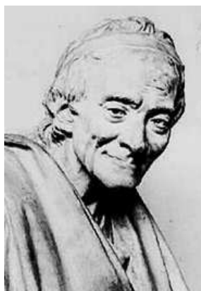
Voltaire a los 80 años de edad.

historia puede referir de las ceremonias de Iniciación y Fúnebre del Gran Voltaire, sólo puede entenderse si se comprende la enorme presencia moral e intelectual que hombres como Helvetius, Diderot, Montesquieu, Rosseau, Cambaceres, Lalande, Franklin, Parny, Lafayette, Washington y otros muchos, tuvieron en la sociedad y en el destino de los pueblos.