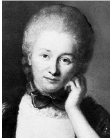
Émilie du Châtelet.

pródigo (1736) y Nanine o el prejuicio vencido (1749), que tuvieron menos éxito que los anteriores.