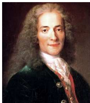
François Marie Arouet, más conocido como Voltaire

François Marie Arouet , más conocido como Voltaire (París, 21 de noviembre de 1694 – ibídem , 30 de mayo de 1778) fue un escritor, historiador, filósofo y abogado francés que figura como uno de los principales representantes de la Ilustración 1 , un período que enfatizó el poder de la razón humana, de la ciencia y el respeto hacia la humanidad. En 1746 Voltaire fue elegido miembro de la Academia francesa.