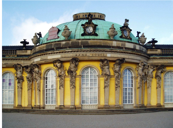
Palacio de Sanssouci.

Ginebra, Suiza, lugar en el que chocó con la mentalidad calvinista 14 . Su afición al teatro y el capítulo dedicado a Miguel Servet 15 en su Ensayo sobre las costumbres (1756) escandalizaron a los ginebrinos.